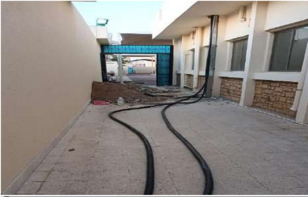
مشروع ترميم معامل العلوم بالمقر الرئيسي طلاب