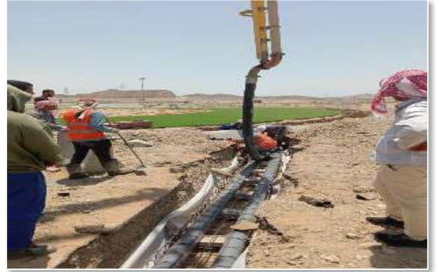
مشروع نقل المولد لمقر التخصصات الصحية بالشرفية